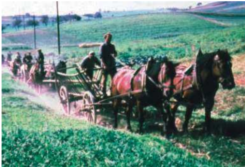
Mit Pferdefuhrwerken wurde Anfang der sechziger Jahre zur Getreideernte ausgerückt. Hier auf der alten Straße nach Geisenhain in der Grube in Richtung Kahlberg.