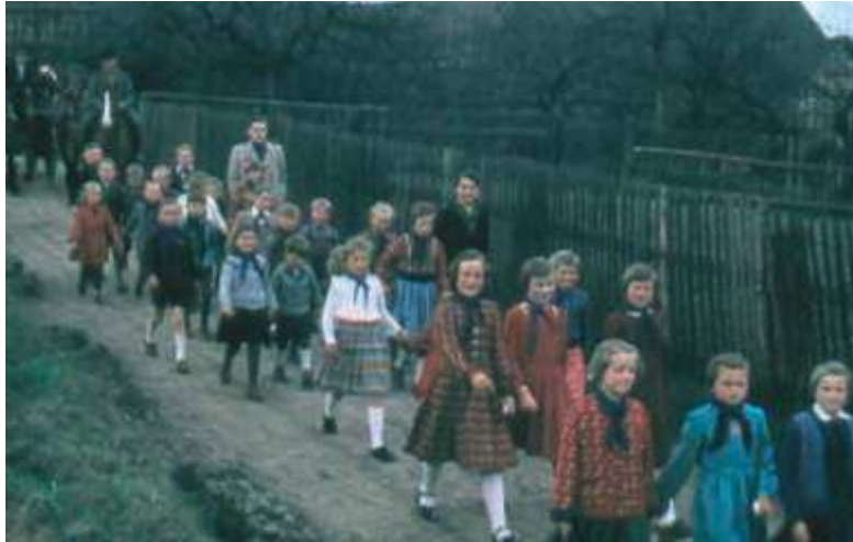
Die Gneuser Schüler in Pionierkleidung bei der Maidemonstration 1958 auf dem Weg von Obergneus nach Untergneus.