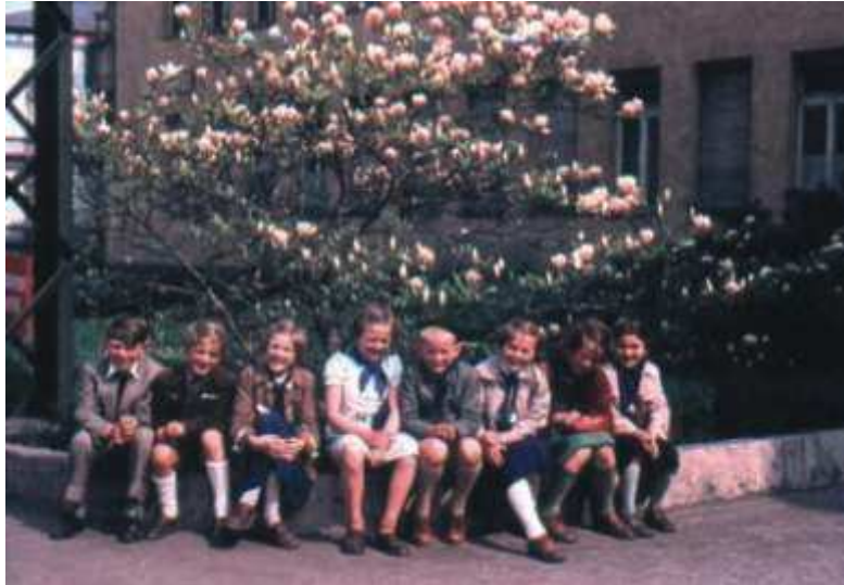
Gneuser Schüler 1959 beim Schulausflug nach Hermsdorf.