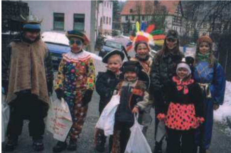
Faschingskinder von Untergneus.