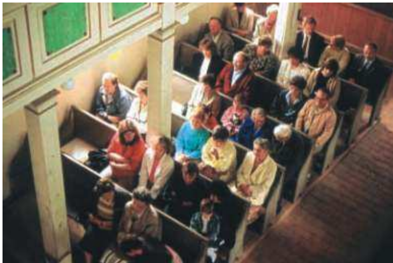
Ein feierlicher Gottesdienst und ein großes Fest wurde am Ende der Sanierungsarbeiten mit dem „Knopffest“ gefeiert.