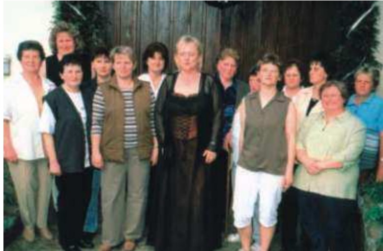
Am Stellen einer Ehrenpforte zur Hochzeit und Hochzeitsjubiläen beteiligt sich meist das ganze Dorf. Die Frauen binden die Girlanden und den Kranz für die Ehrenpforte und die Männer stellen sie auf. Hier die Bindefrauen von Puschmanns Silberhochzeit.