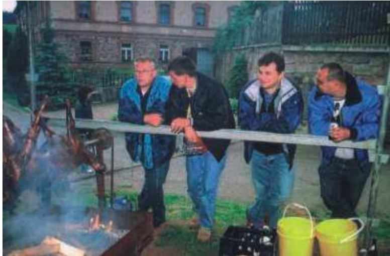
Untergneuser Himmelfahrt beim Schaf am Spieß.