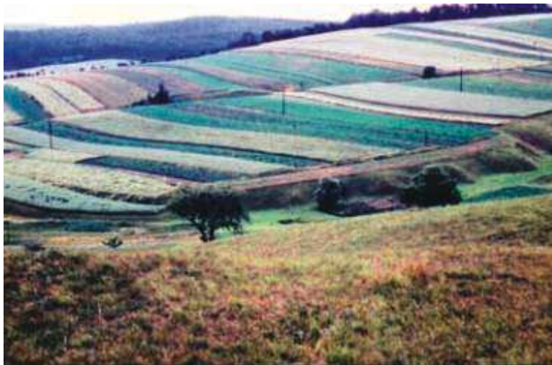
Blick vom Wachtelberg über die Würze zum Gelände, im Hintergrund der Rumsberg. Man kann auf dem Bild vom Ende der fünfziger Jahre noch sehr gut die kleinen Felder der Einzelbauern erkennen.