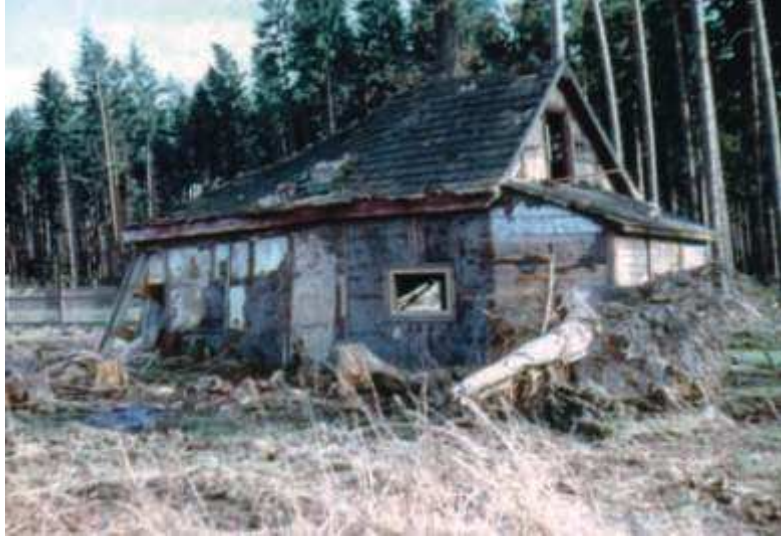
Das Jägerhäuschen auf der Lecke, anfang der sechziger Jahre.