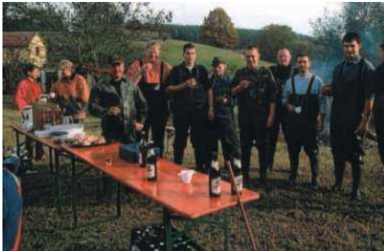
Das Abfischen der Untergneuser Teiche ist immer ein willkommener Grund für ein kleines Fest. Bevor es aber losgeht, müssen sich die Fischer erst mal stärken.