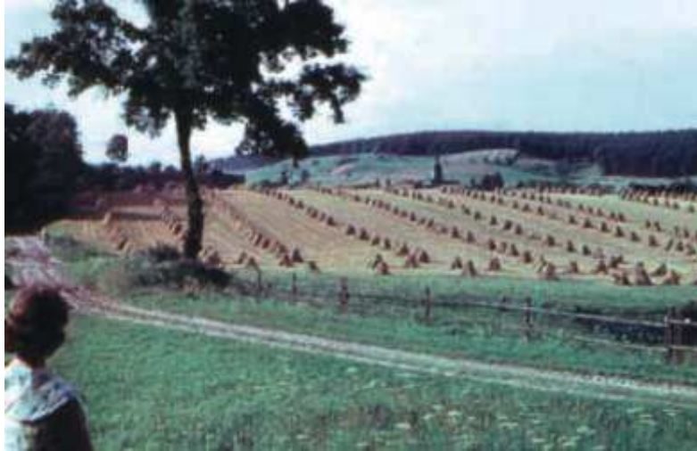
Blick auf Untergneus, links die Fitschelgasse und im Hintergrund der Wachtelberg.