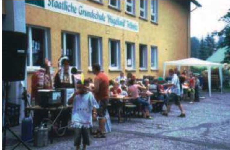
Seit fast 50 Jahren gehen alle Gneuser Kinder in die Tröbnitzer Schule, die heute als „Staatliche Grundschule“ den Namen „Hügelland“ trägt. Unten sieht man die Schüler der 1. Klasse bei ihrer Einschulung 2006 mit ihren Eltern vor dem Schulgebäude.