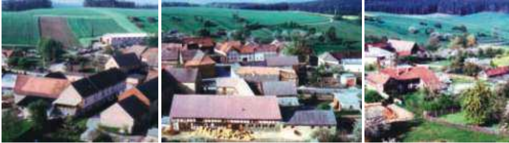
Im Frühjahr 1989 liegt Obergneus noch völlig unberührt von der sich am Horizont abzeichnenden politischen Wende. Alle Häuser haben seitdem ihr Aussehen stark verändert.