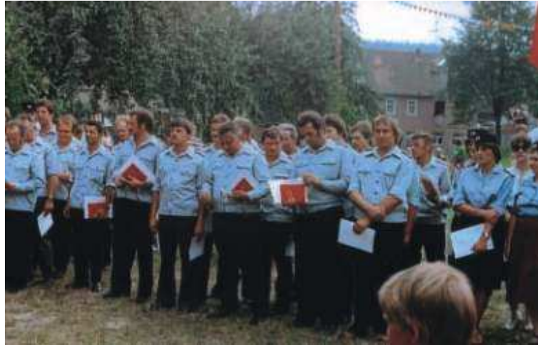
Die Feuerwehr spielt bei der Organisation von Veranstaltungen eine wichtige Rolle. Jahrzehntlang hatten beide Ortsteile ihre eigenen Feuerwehr. Heute sorgt eine gemeinsame Wehr für den Brandschutz. Ein Höhepunkt im Leben der Feuerwehr war das Jahr 1983. Zweihundert Jahre vorher hatten die damals noch selbstständigen Gemeinden Ober- und Untergneus ihre erste gemeinsame Feuerspritze gekauft.