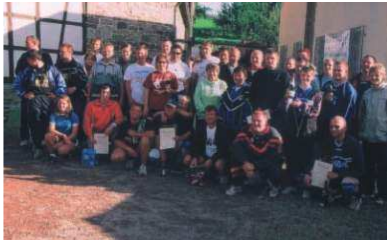
Mit dem Bau eines Volleyballplatzes entwickelte sich bald eine eigene Volleyballmannschaft, die seit 1988 jedes Jahr ein Turnier organisiert; hier alle Teilnehmer von 2004.