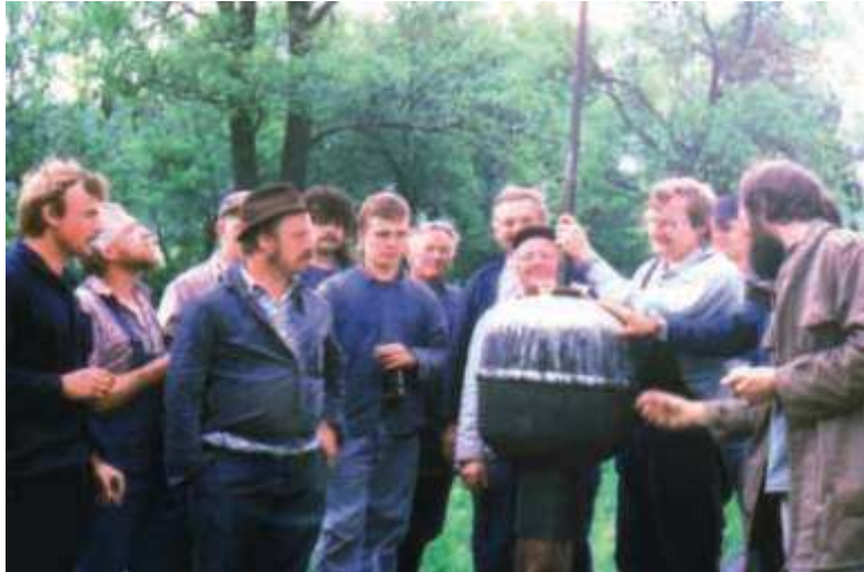
Die Reparatur der Kirche, insbesondere des Daches und des Turmes 1991 wurde von allen Bewohnern mit großem Interesse verfolgt und viele unterstützten dies mit eigener Arbeitsleistung oder Spenden. Hier wurde gerade der Turmknopf abgenommen.