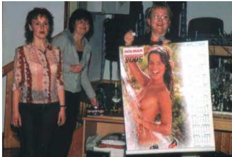
Die Silvesterfeier im Saal in Untergneus wird abwechselnd von den Dörfern organisiert. Außer gutem Essen und Trinken, Tanz und Musik ist immer die Tombola mit originellen Preisen ein Höhepunkt.