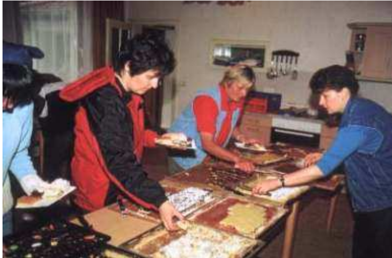
Anlässlich des 50. Heimatabends entstand die Idee alle ehemaligen „Gneuser“ einmal einzuladen. Zu diesem „Gneuser-Treffen“ kamen viele, die vor Jahrzehnten weggezogen waren. Fleißige Helfer und Helferinnen sorgten dafür, dass es an Nichts fehlte.