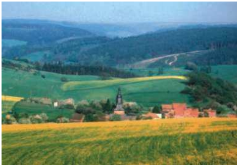
Blick von Obergneus über Untergneus zum Pusterberg (halbrechts). Links hinten sieht man den Kantersberg bei Tröbnitz.