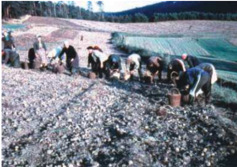
Mitglieder der LPG Typ I 1961 beim Kartoffellesen auf der Fuchsgelänge.