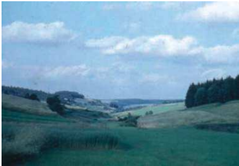
Von der Fitschelgasse hat man einen schönen Blick über die Fitschelwiese in Richtung Geisenhain. Links der Born bzw. Rotacker und rechts das Rodeland, welches erst nach dem Krieg gerodet wurde.