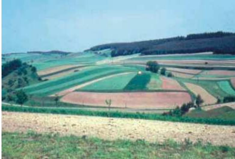
Blick von der Kahlschen Straße über das Pfaffental, den Kahlberg, die Fuchsgelänge zum Wachtelberg. Diese Aufnahme stammt von 1961 nach Gründung der LPG und zeigt schon etwas größere Felder.