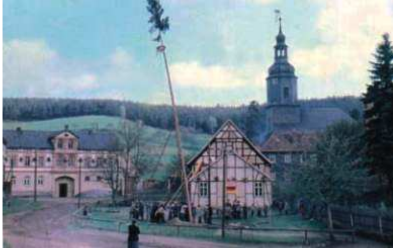
Das Setzen des Maibaumes, hier 1957 in Untergneus, ist bis heute eines der wichtigsten Dorffeste. Im Hintergrund das Haus mit dem Hausnamen bei Hanssierds, rechts das Gemeindehaus noch ohne Anbau und ganz rechts die Schule vor der Kirche.