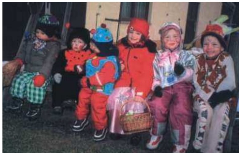
Faschingskinder von Obergneus.