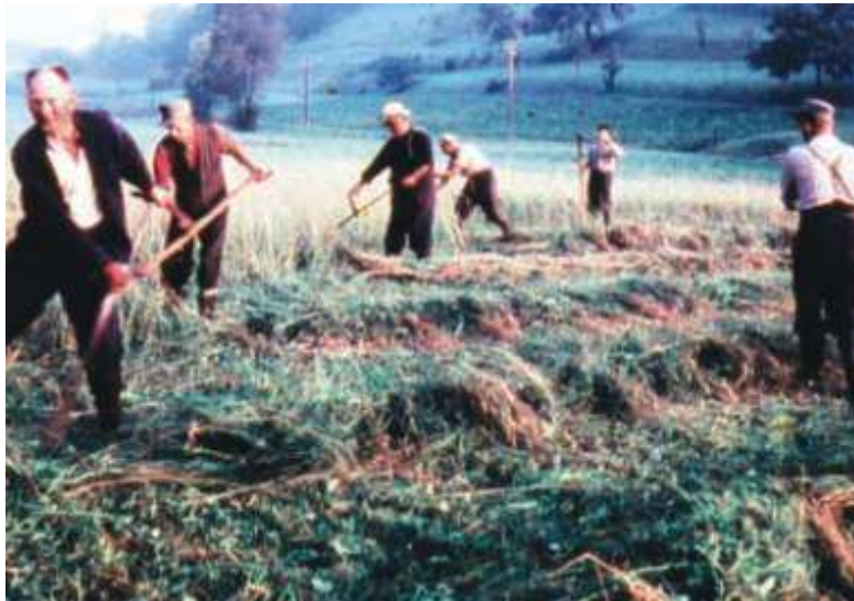
Wiesenmohd auf Seims großer Wiese an der Geisenhainer Straße.