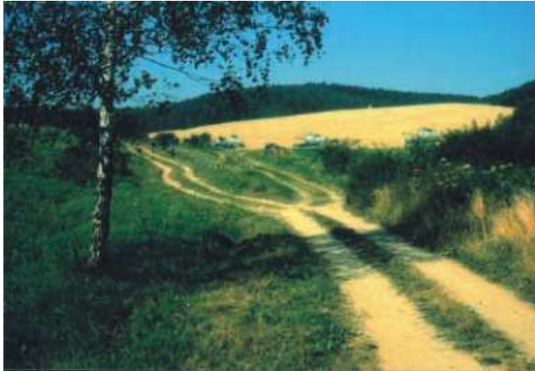
Blick vom oberen Teich ins Seifertstal. Rechts vorn biegt der Weg ins Rumstal ab.