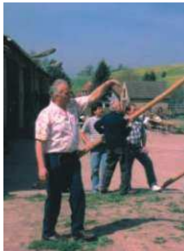
Der Bürgermeister beim Richtfest. Im Hintergrund der „Silberberg“, der im Frühjahr durch den blühenden Löwenzahn wie vergoldet erscheint.