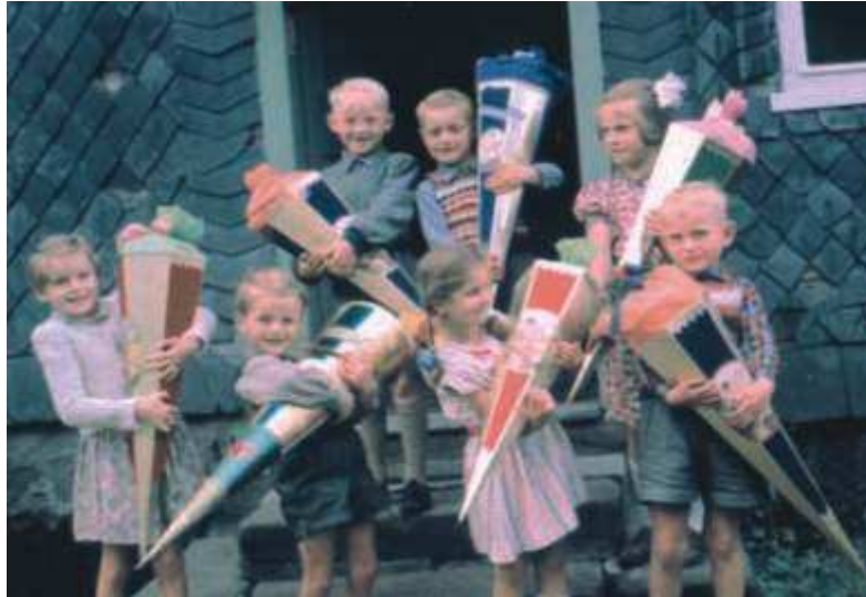
Aus dem Jahre 1956 stammt eines der ersten Farbfotos vom „Zuckertütenjahrgang“.