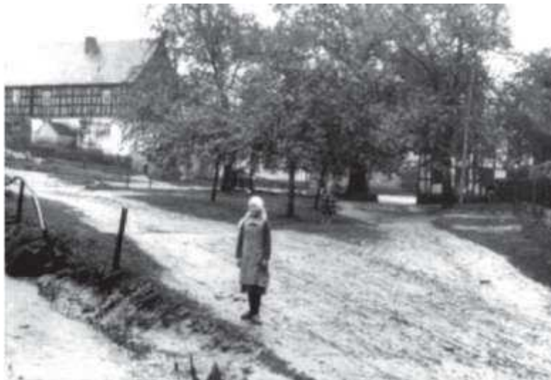
1926 sah der Dorfplatz in Untergneus noch völlig anders aus. Am unteren Bildrand erkennt man den offenen Bach, dahinter links „bei Gröbesens“, etwas weiter rechts die kräftige alte Dorflinde mit einer Steinumfassung und rechts davon die „Loge“.