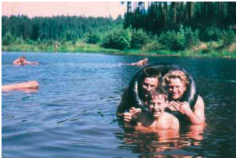
Der Haselanger Teich war früher ein beliebter Badeteich.