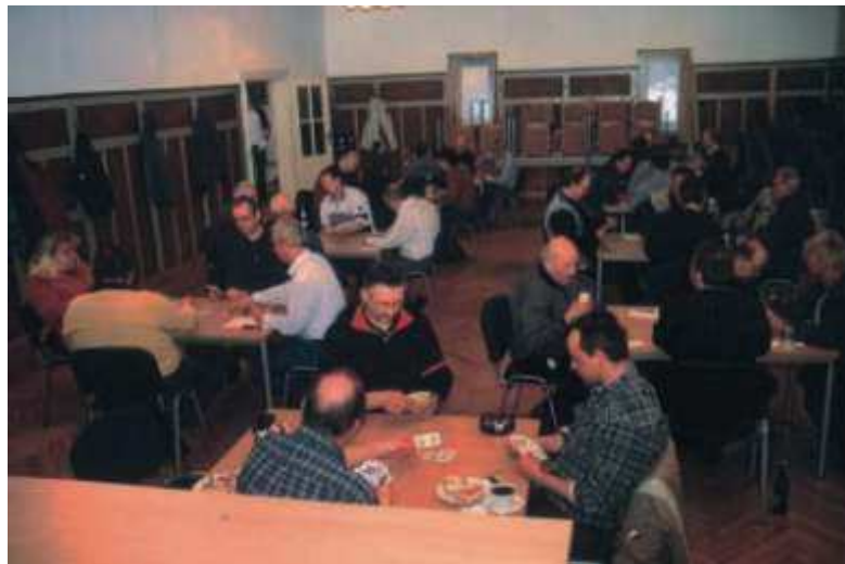
Preis-Skatturniere werden immer im Winter im Saal organisiert.