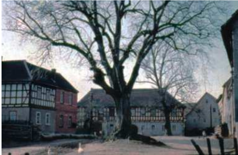
Obergneuser Hausnamen von links: Dyroffs, Hausschneiders, Polzens. Man kann auch noch die beide Linden erkennen, von denen die hintere auf dem sogenannten Linden-berg stand.