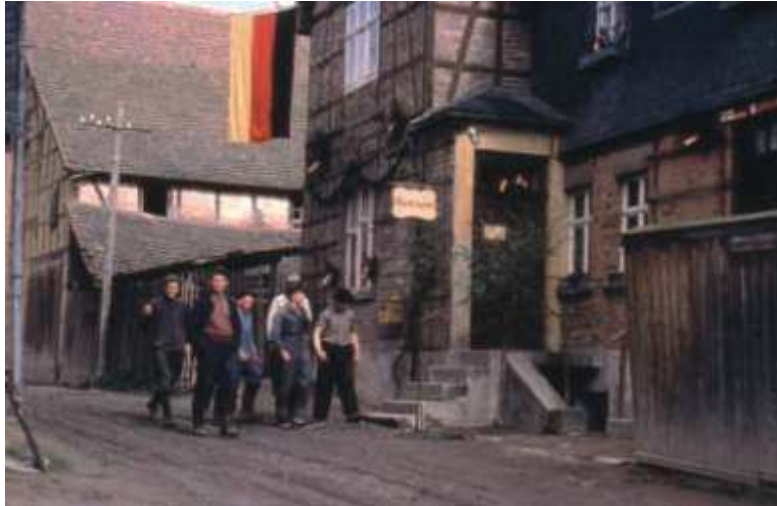
Der Untergneuser Dorfkonsum war für den 1. Mai 1957 festlich geschmückt. Früher war hier die Dorfschänke. Der Konsum zog dann später in das Schulgebäude neben der Kirche. Links vom Konsum ist Böttgers Scheune.