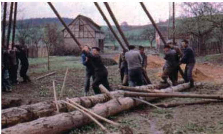
Der Maibaum wird abwechselnd in Unter- und in Obergneus gesetzt. Hier sieht man die Obergneuser 1960 auf dem Anger, etwa an der Stelle, wo auch heute noch der Maibaum gesetzt wird. Im Hintergrund das Gebäude der ehemaligen Saatgutreinigung in das Teile des alten Brauhauses bei Bau mit einbezogen wurden. Hier befinden sich jetzt die Gebäude der Agrargenossenschaft.