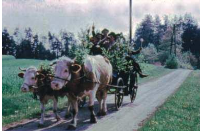
Himmelfahrt wird in den beiden Ortsteilen separat gefeiert. Oben die Obergneuser Himmelfahrtspartie im Jahre 1959 und unten werden schon die Jüngsten 2006 an die Traditionen herangeführt.