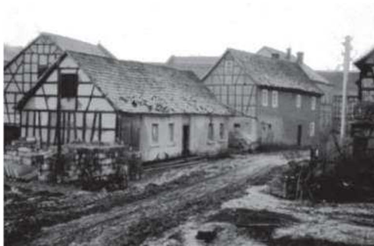
Das nicht mehr existierende Gemeindehaus in Obergneus, in dem links der Leichenwagen eingestellt war und sich der Erntekindergarten befand; rechts daneben das Haus von Menzels hieß bei „Rinderhardts“.