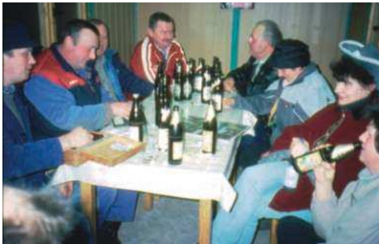
Auch die Erwachsenen lassen den Fasching nicht ohne ein kleines Fest verstreichen.