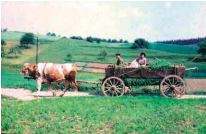
Die Straße von Untergneus nach Obergneus, im Hintergrund der Starkacker.